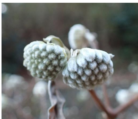
ミツマタ (三桎) 江向家ほか