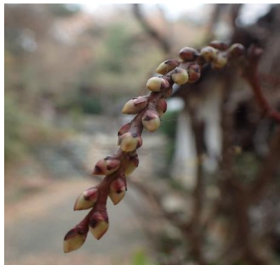
キブシ(木五倍子) 井岡家ほか