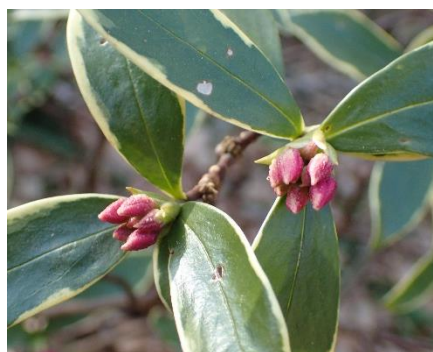
ジンチョウゲ (沈丁花) 北村家ほか