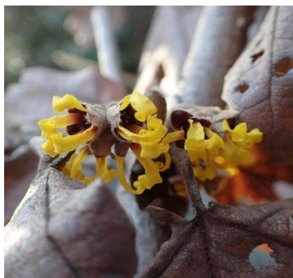
マンサク (万作) 江向家