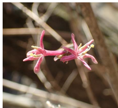
ウグイスカグラ (鶯神楽) 佐々木家ほか