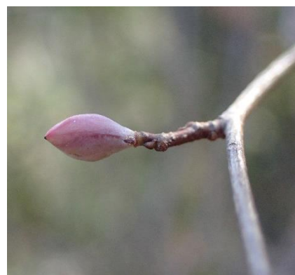
ヒュウガミズキ (日向水木) 作田家