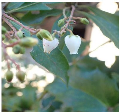
アセビ (馬酔木) 佐地家