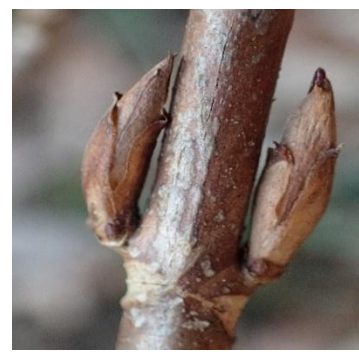
アマチャ (甘茶) 北村家