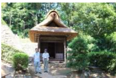
蚕影山祠堂（木曜班）