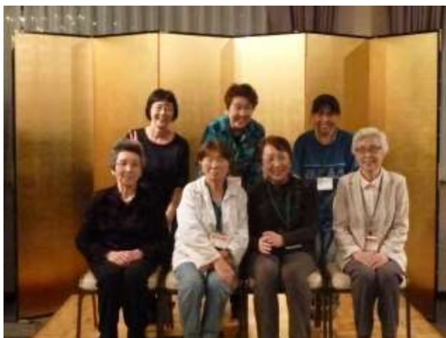
期・班・グループなど日頃一緒に活躍している人が集まっての写真撮影も多く行われました (左は経験20年の1期の皆さん+α、右は入会1年目の14期の皆さん)