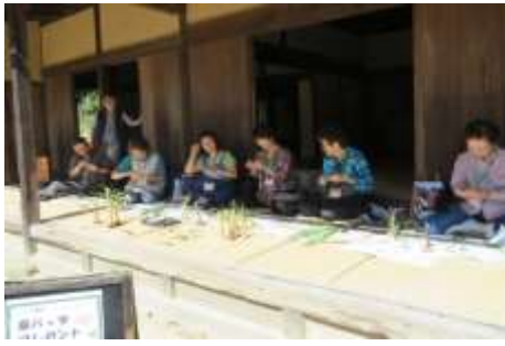
午前の草バッタチーム（金曜班）