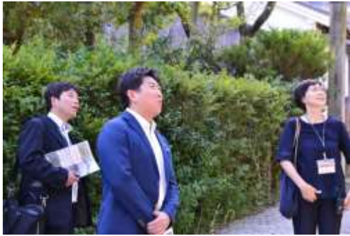
市長は園長の案内で視察を開始