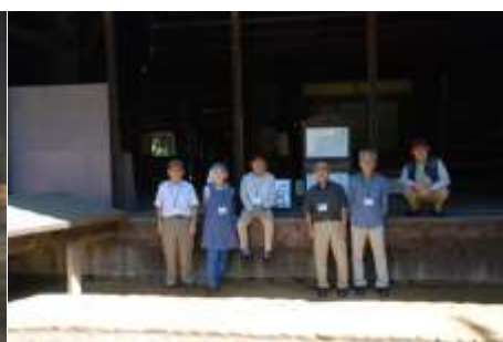
船越の舞台（木曜班）