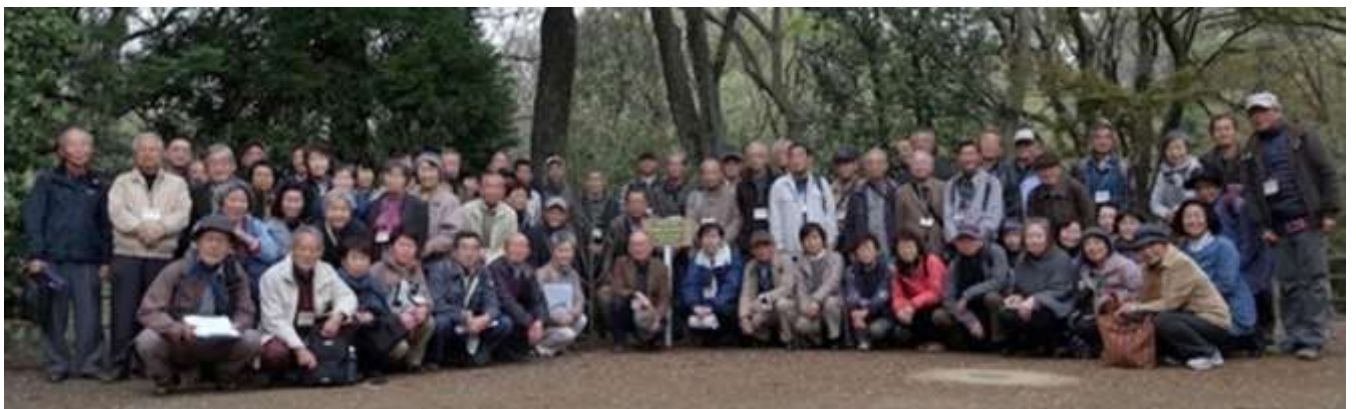
記念植樹参加者の集合写真