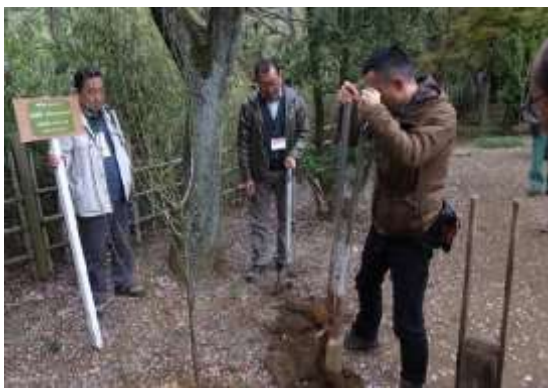
記念植樹仮立札の設置