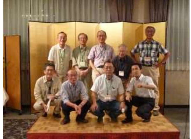
20周年行事を計画・実行した委員の皆さん