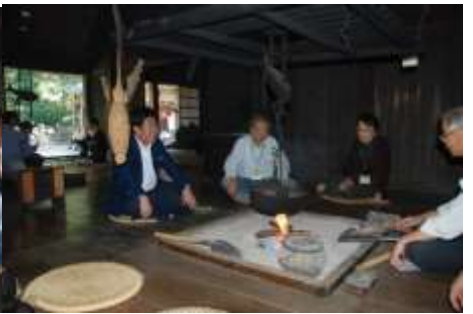
市長は野原家で囲炉裏を囲み、前会長・元副会長・1期の皆さんが対応