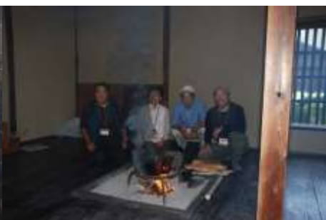
佐地家供待ち（土曜日）