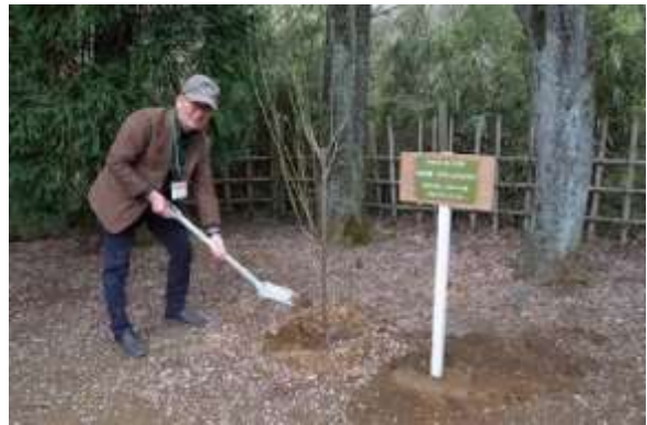
野田会長による鋤入れ式