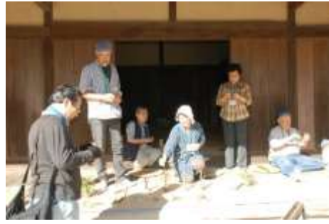
午後の草バッタチーム（水曜班）