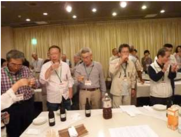
会場のあちらこちらで話が弾んでいました