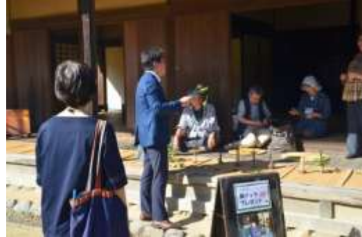
佐々木家では草バッタを贈られ大喜び