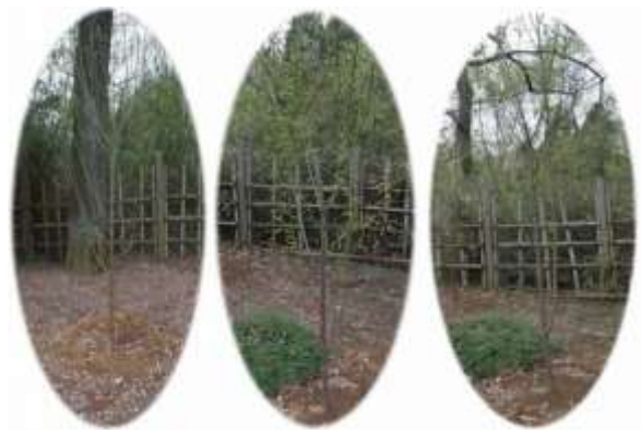
記念植樹の場所と植樹された3本のコウシュウコウメ